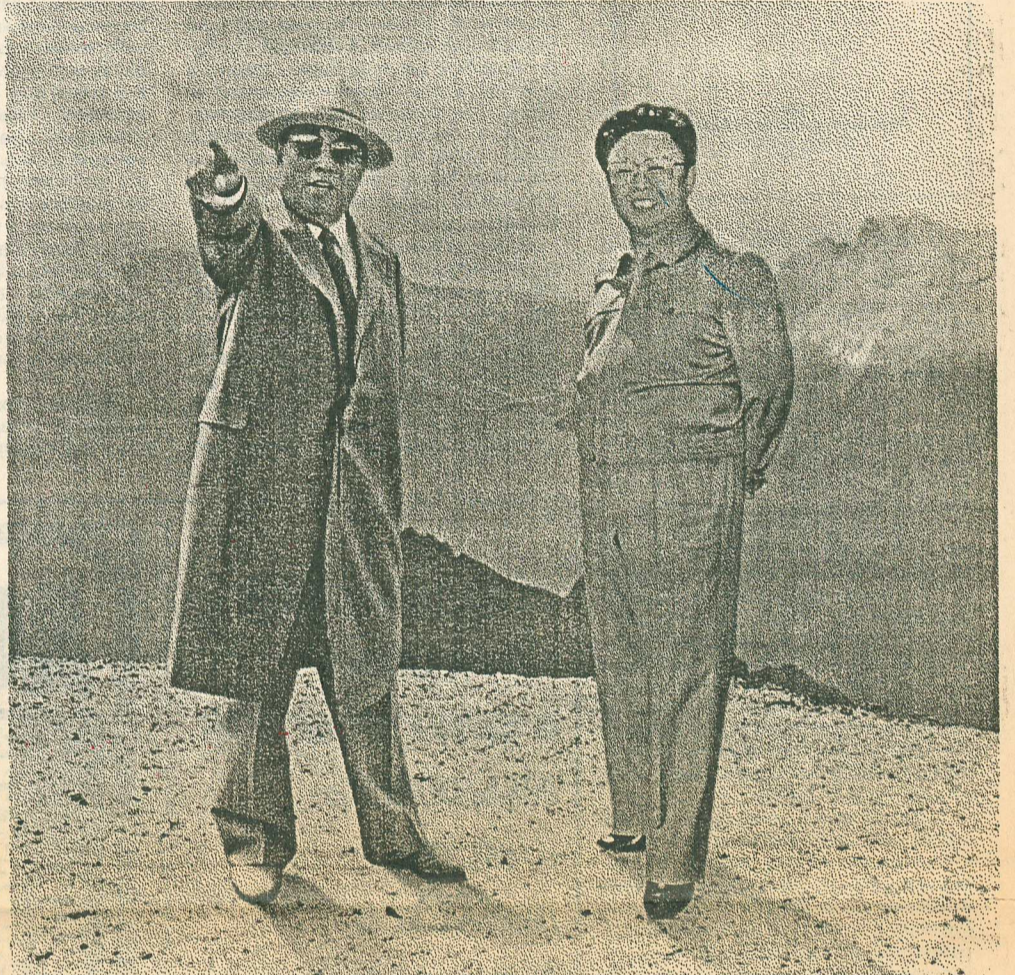
Товарищ Ким Ир Сен и сегодняшний руководитель корейского народа и всемирного чучхейского революционного движения товарищ Ким Чен Ир на вершине горы Пэкту.

ные великим вождем товарищем Ким Ир Сенем в отношении литературы и искусства, он разработал оригинальный курс, направленный на новый подъем в литературе и искусстве. В результате успешного