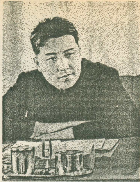
Ким Ир Сен — молодой руководитель в рабочем кабинете Народного Комитета Северной Кореи.

Выдвинув оригинальный курс на социалистическую индустриализацию, товарищ Ким Ир Сен мудро руководил борьбой за его реализацию и в сжатые сроки, всего лишь за 14 лет (1957 — 1970) превратил Корею в мощное социалистическое индустриальное го-