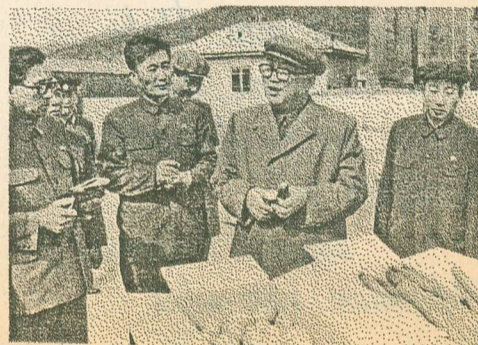
Неистощимая энергия: всегда с народом. Товарищ Ким Ир Сен руководит работой овощной теплицы госхоза уезда Сонбон.

зону, о вывозе американского ядерного оружия из Южной Кореи о проведении между Севером и Югом военно-политических переговоров на высоком уровне, о созыве политического консультативного совещания деятелей руководящего ранга Севера и Юга, которые могут представлять интересы различных политических партий, группировок и слоев населения Севера и Юга.