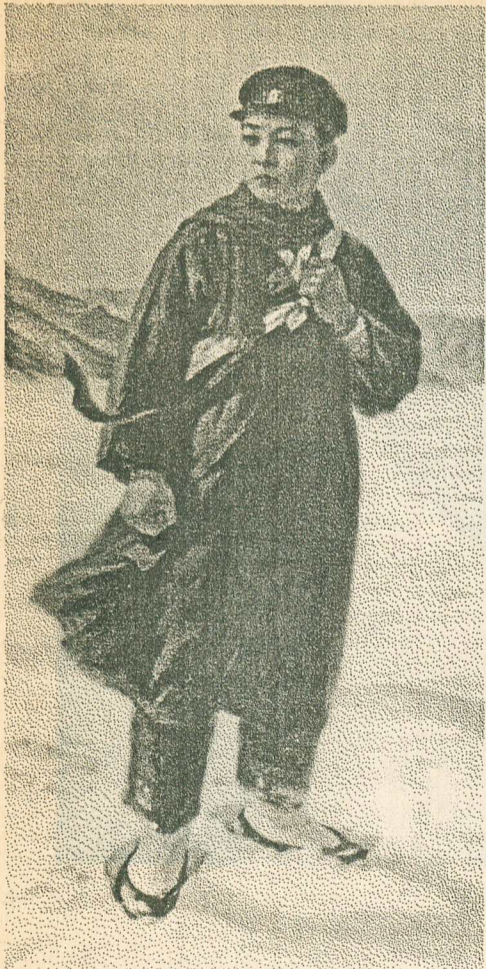
Молодой коммунист Ким Ир Сен, исполненный решимости освободить Родину, переправляется через реку Амнок.

В июне 1930 года он, созвав совещание руководящих кадров комсомола и Антиимпериалистического союза молодежи выдвинул принципы идей чучхе. Он также дал научное