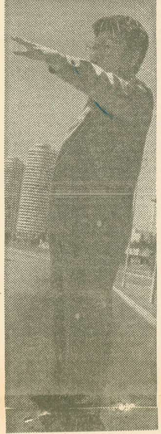
Товарищ Ким Ир Сен

Субъект революции — единство вождя, партии, масс. Как единый монолит они есть сильный субъект революционных преобразований. В отрыве от идей и руководства вождя массы не могут играть роль субъекта революции, а партия немедленно как революционная организация. Идея и теория товарища Ким Ир Сена следует последовательно воплощать в строительстве и деятельности партии рабочего класса.