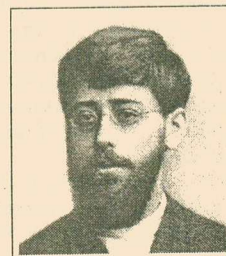
Ю.О. ЦЕДЕРБАУМ (Мартов)

Раскрытие его дело вызвало в ту пору немало шума. «Спрашивается, как быть с ними в одной партии? Воображаю, как возмущены немцы», — с негодованием писал в частном письме Мартов. Чичерин потребовал назначения партийной следственной комиссии. Ленин охотно согласился на строжайшее расследование дела, организованного по его прямому пред-