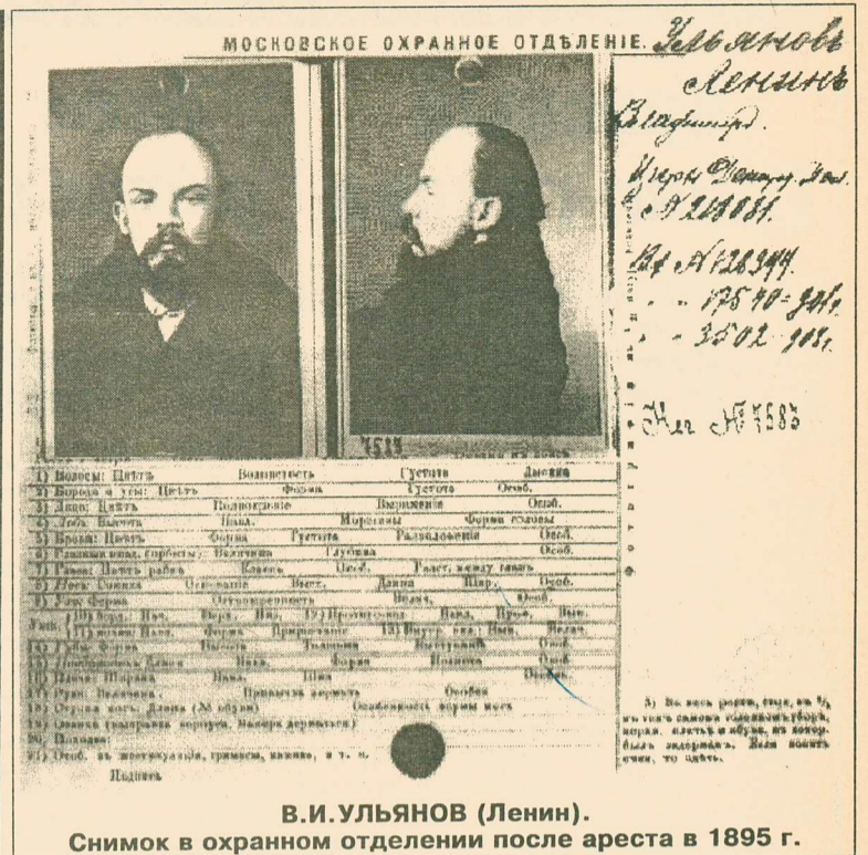
В.И. УЛЬЯНОВ (Ленин). Снимок в охранном отделении после ареста в 1895 г.