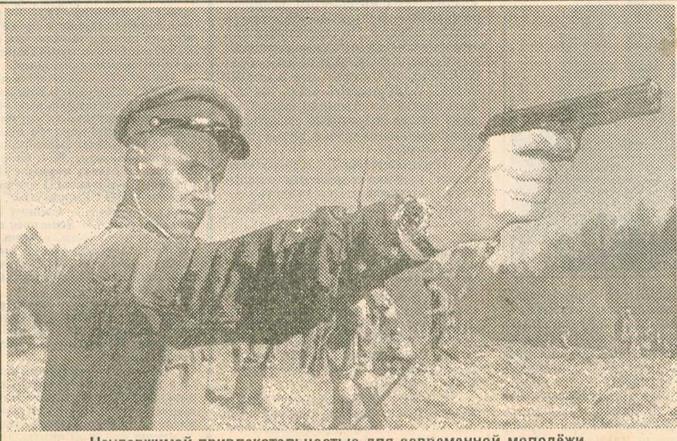
Неудержимой привлекательностью для современной молодежи обладает форма РККА и НКВД.

Зюганов поздравил Алексея II с днем рождения. При чтении поздравления создавалось впечатление нереальности. “Лидер коммунистов” поздравляет не какого-нибудь там “теолога освобождения” или “красного попа”, а лужовско-ельцинского прислужника! В стране воцарилось такое мракобесие, что молодые люди определяют свою совместимость по гороскопам, а Геннадий Андреевич определяет этот маразм как “возрождение духовности”. Церковь ханжески обеспечивает “очистку” совести тысяч как воров-бизнесменов, так и их киллеров. Православная Церковь — не более, чем крупнейшая из сект в России, разве что не выполняющая функции вестернизации. Потому и отношение к ней может быть более мягкое, нежели ко всяким хаббардистам и мунитам (кстати, отъявленным антикоммунистам).