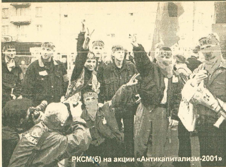
РКСМ(б) на акции «Антикапитализм-2001»

...Никакого прорыва мы не планировали и, честно говоря, не ожидали. Когда колонна подходила к Горбатовому мосту, я была во втором ряду. Перед милицией мы оцеплением остановились. Милиция пыталась отодвинуть нас назад, но никто не отступал и не расходился. Справа шли РКСМБшники, слева - какие-то анархи, мы сцепились локтями. Задние ряды стали напирать, и мы невольно двинулись вперед. Кто-то из ребят бросил за ментовское ограждение петарду, из-за давки цепочка разорвалась, мы еле устояли на ногах. Стоявший слева от меня парень в футболке «анархия» извинился и стал уводить из толпы свою девушку. В толкотне нам снова удалось создать цепочку, теперь справа от меня стоял В.Ш-в. Столкновение стало неизбежным, - нас просто «несло» вперед.